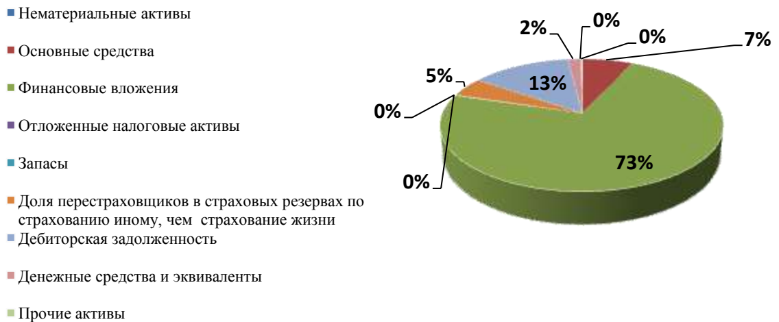
Рис. 2. Структура активов ООО «XXX» за 2013 г.